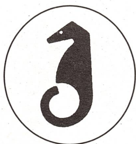
Das japanische Schriftzeichen für «gehörlos» gleicht einem Seepferd. Es ist auch das Symbol der japanischen Gehörlosengemeinschaft.

Engagiert in der japanischen Gehörlosenselbsthilfe, hält sie Vorträge über die Gehörlosensbewegungen in fremden Ländern, die sie bereist hatte (zum Beispiel Südostasien, Australien, Europa, USA). Nebst dem Reisen gehören Wellenreiten und Skifahren zu ihren Hobbys. Als persönliches Ziel bezeichnet sie die Weiterbildung. Ausserdem möchte sie einige Jahre in Europa leben und arbeiten. Wer weiss, vielleicht werden wir die unternehmungslustige Japanerin bald wieder in der Schweiz antreffen.