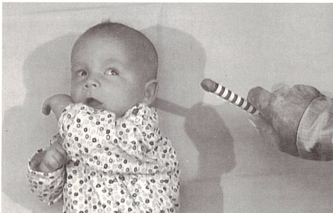
... wenn das Kind entwicklungsmässig noch nicht so weit oder jünger ist, reagiert es mit Horchen. Hier als Beispiel: Die Augen drehen nach der Geräuschquelle.

der Schweizerischen Vereinigung der Eltern hörgeschädigter Kinder SVEHK, ein Vertreter der Betroffenen, ein Audiologe, HNO-Spezialarzt, ein Kinderarzt.