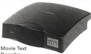
Movie Text Decoder.

(Dienstleistungs- marke des ECI (European Captioning Institute Ltd.)