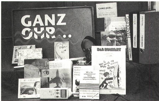
Die Medienkiste regt zur Auseinandersetzung mit dem Themenkreis Gehör und Lärm an