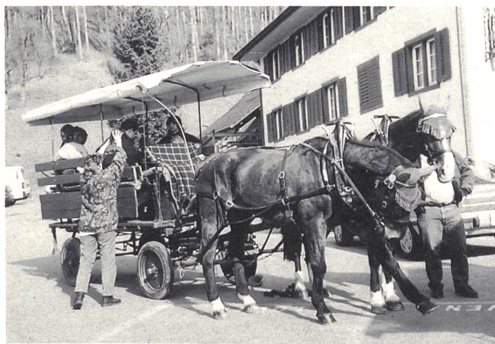
Beim Einstieg in die Kutsche in Hausen a. Albis

Die Schlittel- wie die Skigruppe genossen die herrlichen Verhältnisse sichtlich.