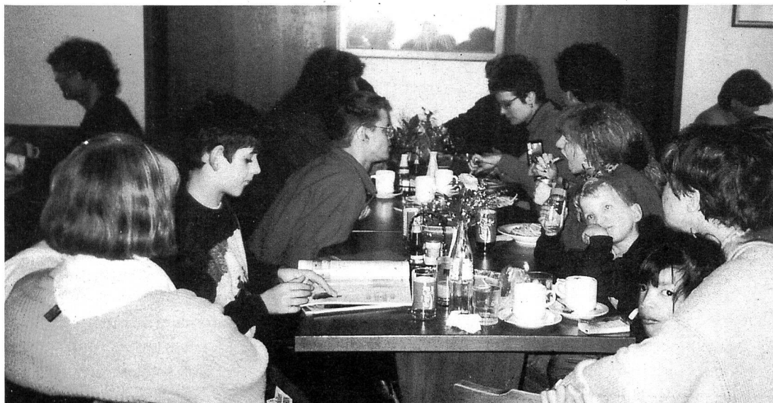
Beim Essen im Restaurant Brunni

«Tanne» ein Vorteil, für andere wäre vielleicht eine neue Umgebung interessanter gewesen. Wie das Sportlager nächstes Jahr aussehen wird, wissen wir noch nicht. Jedoch freuen wir uns schon jetzt wieder darauf.