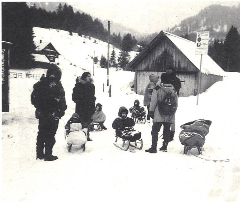
Warm eingepackt steht die Schlittelgruppe in der Kälte.

fahrt angesagt. Nach einem reichhaltigen Brunch (Zmorge-Zmittag) verliessen wir gegen Mittag die Tanne in Richtung Hausen am Albis. Dort hiess es umsteigen auf Pferdekutschen. In gemütlichem Tempo fuhren wir durch Wald und Feld zum Restaurant Schweikhof. Dort gab es ein Zvieri. Auch heute spielte das Wetter wieder gut mit. Die bereitgemachten Wolldecken waren zum Glück überflüssig. Besonders auch unseren blinden Kindern gefiel die Fahrt gut, da sie die Vibration auf dem Wagen spürten und den Geruch der Pferde erkannten.