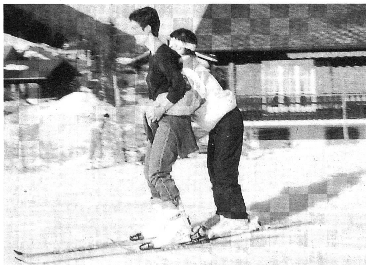
«Mit deinen Skis zwischen meine, festhalten und ab geht's»

Starker Schneefall liess uns an unserem letzten Lagertag den Winter nochmals so richtig spüren. Gut eingepackt in warme Kleider konnten wir uns