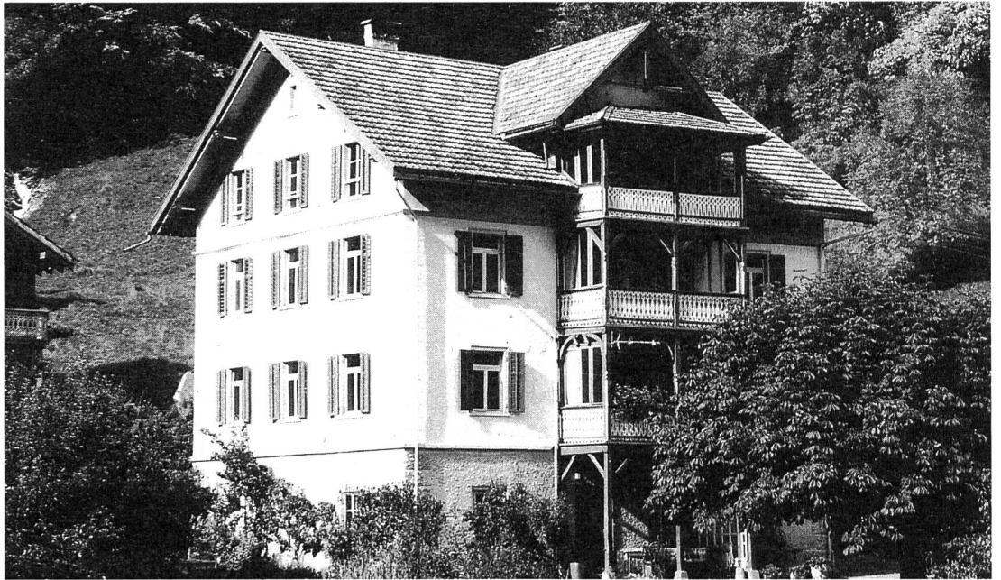
Die Genossenschaft Fontana Passugg erwarb am 1. Mai 1993 das Haus Fontana in Passugg bei Chur. Es steht gehörlosen, schwerhörigen und späterraubten Menschen offen für berufliche und persönliche Bildung, Begegnung und Erholung.

Organisationen soll die Zahl auf deren 70 reduziert werden!)