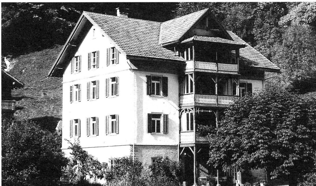
Die Genossenschaft Fontana Passugg erwarb am 1. Mai 1993 das Haus Fontana in Passugg bei Chur. Es steht gehörlosen, schwerhörigen und späterschwerhörigen Menschen offen für berufliche und persönliche Bildung, Begegnung und Erholung.

Organisationen soll die Zahl auf deren 70 reduziert werden!)