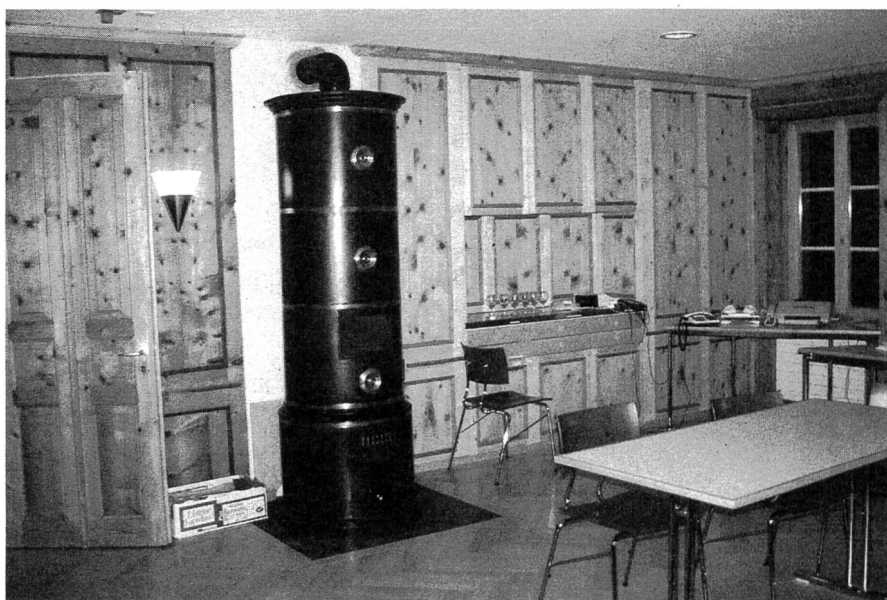
Für wohlige Wärme sorgt der Holzofen im grossen Saal, wo man sich zu den Mahlzeiten und zur Gesprächsrunde traf.

Darüber informiert Sie das nachstehend abgedruckte, in Passugg gemeinsam ausgearbeitete Communiqué.