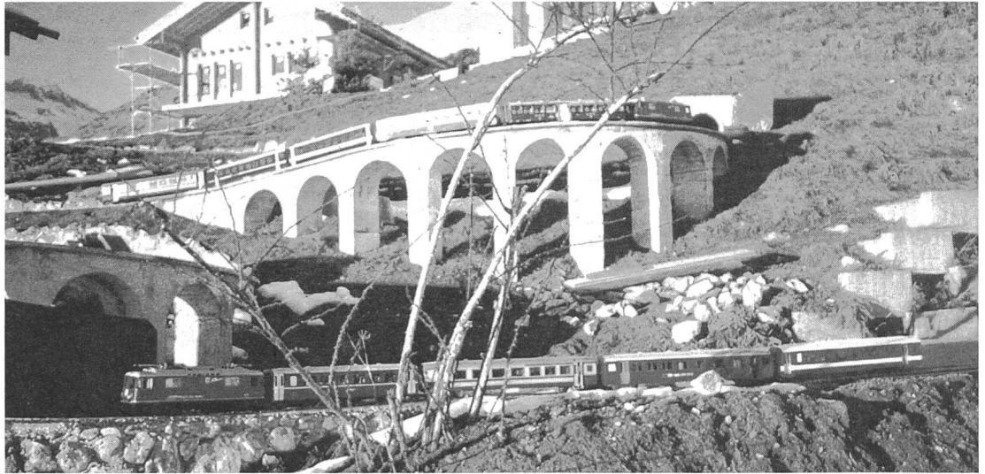
Die Modelleisenbahn in Pedrini's Garten umfasst 80 Meter Länge auf 4 m Höhenunterschied

Bruno Pedrini baut Modelleisenbahnen aus Leidenschaft