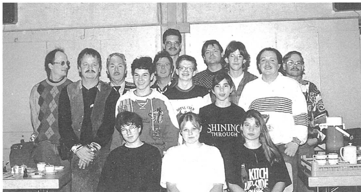
Schweizer EM auf dem Landenhof

Bei den Schülern kam die Stunde der Wahrheit, die bei-