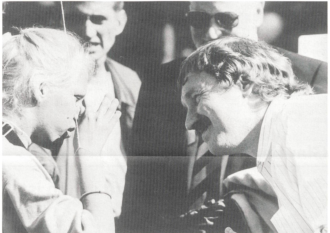
«Begegnung schafft Verstehen».

Durch die gute Organisation und Medienarbeit des Organisationskomitees war die Presse schon im Vorfeld aktiv. So berichteten die Bernischen Zeitungen am Samstag in grossen Artikeln über den Sinn und Zweck der Kundgebung und über Lautsprache und Gebärdensprache. Die Berner Bevölkerung war orientiert und schaute aufmerksam der bunten und