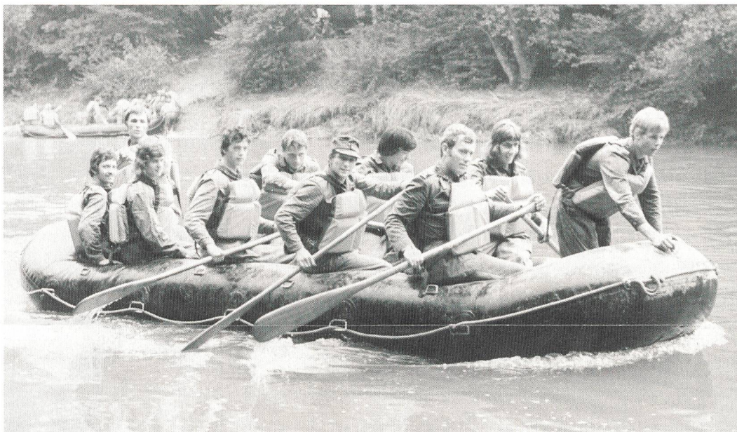
Es war ein langer Weg: Gehörlose und alle, die eine IV-Rente oder Hilflosenentschädigung erhalten, sind vom Militärpflichtersatz befreit.

Dank einem Antrag von Nationalrat Marc Suter (er ist selbst querschnittgelähmt) müssen auch weitere Personen keinen Militärpflichtersatz mehr bezahlen. Unter diese Bestimmung fallen zum Beispiel Gehörlose oder Kleinwüchsige, die dienstuntauglich sind und keine IV-Rente oder Hilflosenentschädigung erhalten.