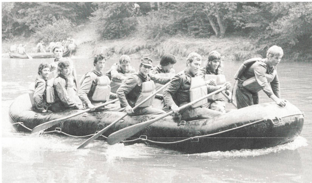
Es war ein langer Weg: Gehörlose und alle, die eine IV-Rente oder Hilflosenentschädigung erhalten, sind vom Militärpflichtersatz befreit.