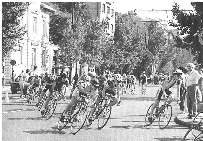
Die Schweizer Sprinter beim 50-km-Strassen-Radpunktfahren.

Abbou/Teboul (FRA) – Läubli/Bivetti (SUI) 6:2, 6:0; Deladoëy/Niggli (SUI) – Papadopolu/Sburlea (ROM) 6:3, 2:6, 2:6.