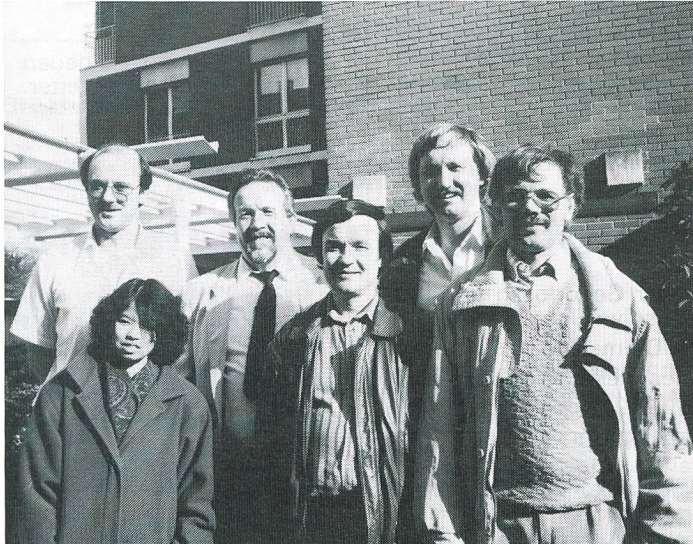
Nach getaner Arbeit posiert der Vorstand in der Abendsonne.

(Isu) Die Delegiertenversammlung des SGSV fand am 6. April 1991 in Lugano statt, ausserdem auch eine Vorstands-Ersatzwahl. Aussergewöhnliches gab es von dieser DV nichts zu berichten.