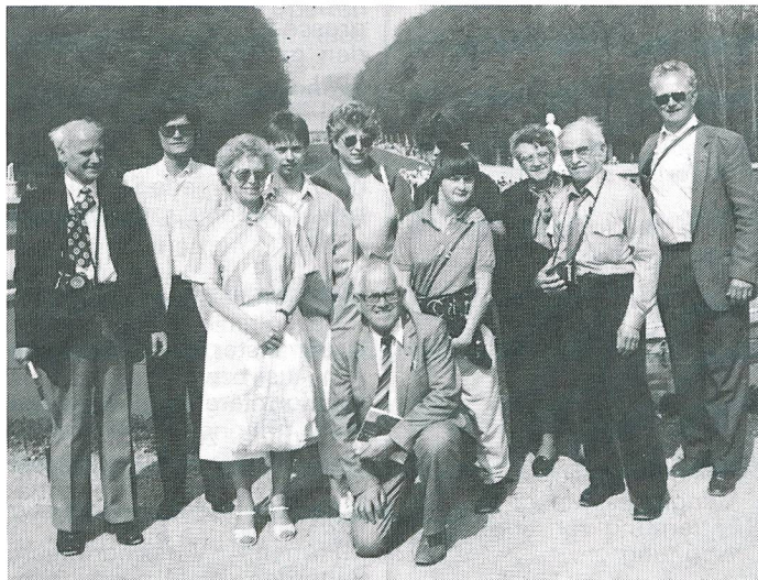
1986 führte uns die Jubiläumsreise nach Paris.