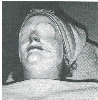
Ratebild: Wer ist die Dame, die sich hier verschönern lässt?