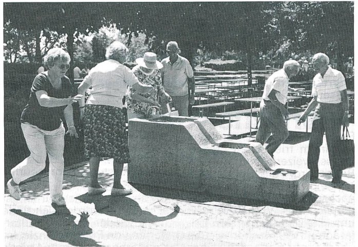
Frohlich wie Kinder bespritzte man sich am Brunnen mit dem erfrischenden Nass.

Rolle zu unseren Füssen war sehenswert. Trotz der Hitze machten wir noch einen Rundgang durch die Anlagen und löschten den Durst nochmals. Nach einer Abkühlung am Brunnen bestiegen wir wieder den Bus und fuhren auf den Col de Marchairuz (1447 m), dann hinab bei Sentier dem Lac de Joux entlang nach Le Pont, wo es nochmals Gelegenheit gab, etwas zu trinken. Jedoch die Zeit mahnte, und so konnten wir nicht lange bleiben.