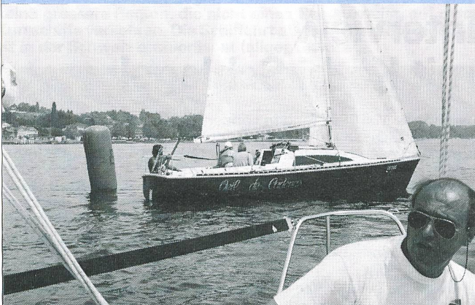
Die Handicap-Trophy wird auf Schiffen vom Typ «Surprise» gesegelt.

Segel-Weltmeisterschaften der Behinderten 29. Juni bis 7. Juli 1991, Nyon VD