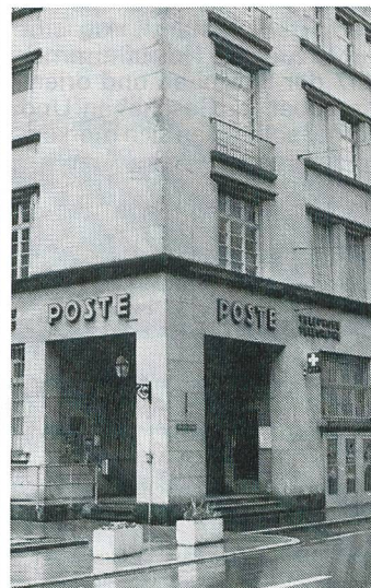
Postbüros erhalten immer wieder unerwünschten Besuch.

Und Kassiererinnen und Kassierer werden zusätzlich geraten, zuerst kleine Noten auszuhändigen, wenn Geld verlangt wird. Die Notenbündel sind aufzureissen, damit es nach