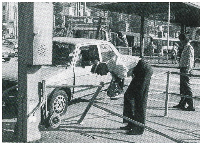
Spurensicherung nach einem Bijouterie-Überfall in Muralto.

Einzelnummer Fr. 2.– Jahresabonnement Fr. 39.– Ausland Fr. 45.– Postcheck-Nr. 30-35953-2 Bern