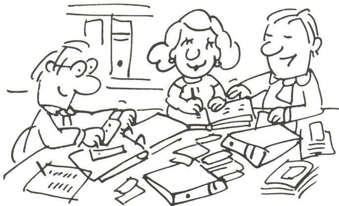
Da ist eine sorgfältige Buchhaltung wichtig!

Wer hingegen alleinstehend ist und ebenfalls 4000 Franken im Monat zur Verfügung hat, der kann sich, um im Mittelfeld zu liegen, eine Wohnung für 612 Franken leisten. Getränke und Tabakwaren für 128 Franken und Bekleidung für 180 Franken im Monat – für sich allein, wohlgemerkt! Unter den Bezüglern kleinerer und mittlerer Einkommen sind die «Singles» (= Einzelpersonen) eindeutig konsumstärker.