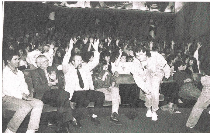
Applaus beim Publikum!

Wie finden Sie diesen Film, liebe Leser? Den SVG interessiert dies sehr. Schreiben Sie Ihre Meinung an den SVG – Achtung, neue Adresse!