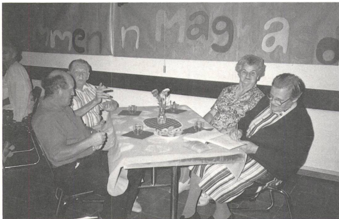
Wir sitzen so traulich beisammen...