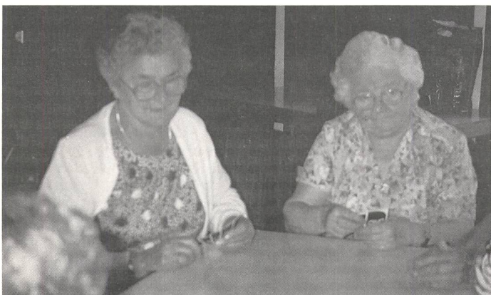
Beim «Uno» mit Feuereifer dabei.