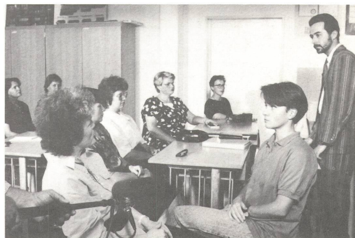
Teilnahme einer gehörlosen Frau mit einer Dolmetscherin an einem Vortrag für Hörende über «Amnesty international».