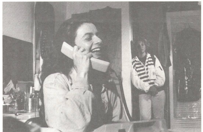
Die Hauptdarstellerin beobachtet nachdenklich-traurig das herzliche Lachen einer Hörenden bei einem Telefongespräch. Am Schreibtelefon sind Gefühle nicht sichtbar.