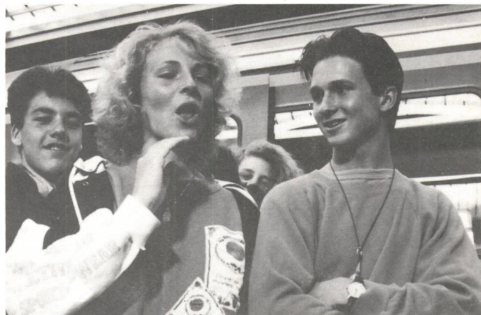
Die beiden jungen gehörlosen Hauptdarsteller.