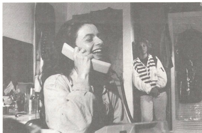
Die Hauptdarstellerin beobachtet nachdenklich-traurig das herzliche Lachen einer Hörenden bei einem Telefongespräch. Am Schreibtelefon sind Gefühle nicht sichtbar.