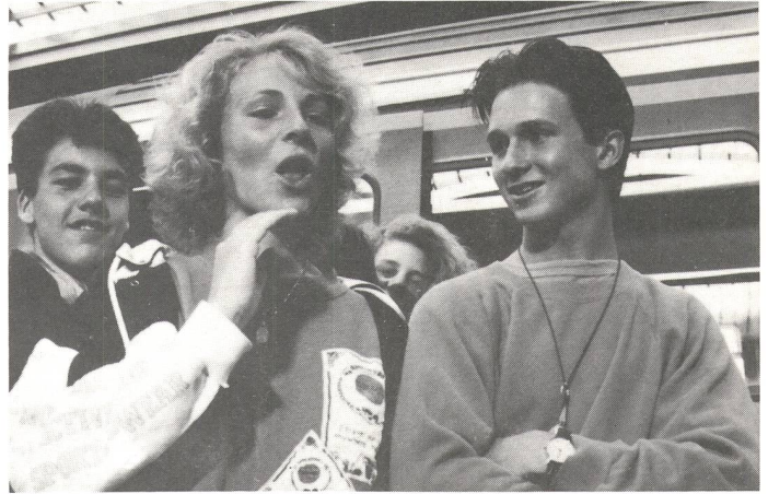
Die beiden jungen gehörlosen Hauptdarsteller.