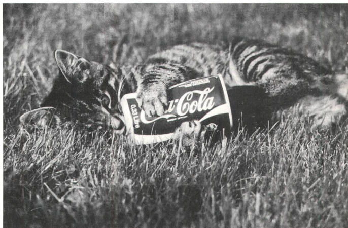
Motiv: Spielende Katzen oder «Coca-Cola ist überall dabei. . .»