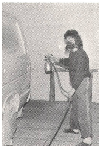
Spritzen mit der Maske.