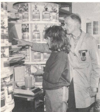
Farbton ausmischen am Computer zusammen mit dem Chef.