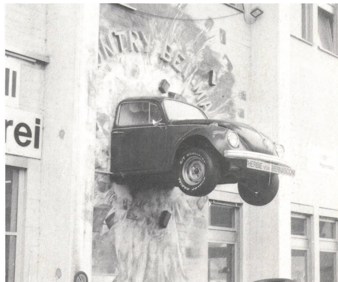
Auch der VW Käfer gehört der Vergangenheit an.

(wag) Als 1890 in der Schweiz die ersten Autos aufkamen, hat man sie bestaunt, und als sie dann immer schneller und besser wurden, begann man sie zu hassen. Wo ein Auto durch die Landschaft fuhr, liess es eine stickige Staubwolke hinter sich, denn es gab damals noch keine Asphaltstrassen. Und die Autos damals waren auch sehr lärmig. Um die Fussgänger vor diesen Belästigungen zu schützen, hat man sogar Sonntagsfahrverbote eingeführt.