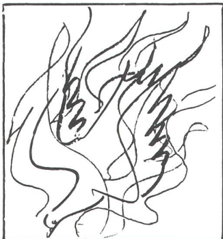
Signet der Basler Versammlung: Friedenstaube und Pfingstfeuer.

Der symbolische Akt soll zeigen: Wir Menschen leben über einem gefährlichen Abgrund. Die Weltbevölkerung wird immer grösser. Mit ihr wachsen auch die Probleme. Sie heissen Gewalt und Krieg, Unterdrückung und Ausbeutung, Verschuldung und Hunger, technische Pannen und Umweltzerstörung. Die ganze Schöpfung ist bedroht und mit ihr das gesamte Leben auf unserem Planeten.