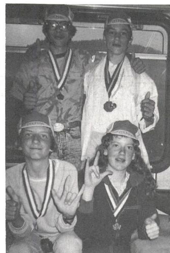
Die Schweiz hat den 6. Preis gewonnen.

Am nächsten Morgen stehen wir um 4.30 Uhr auf. Nach einem langen Tag holen uns die Eltern in Zürich wieder ab. Diese Reise hat mir sehr gut gefallen.