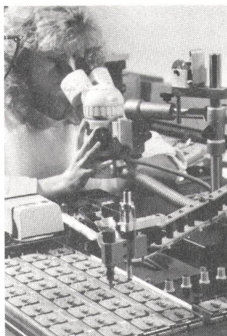
Bild rechts: Einrichtung eines ultramodernen Roboters für die vollautomatische Bestückung elektronischer Komponenten.)

(Bild links: Arbeitsplatz für die hochpräzise Montage der winzigen Im-Ohr-Hörgeräte.