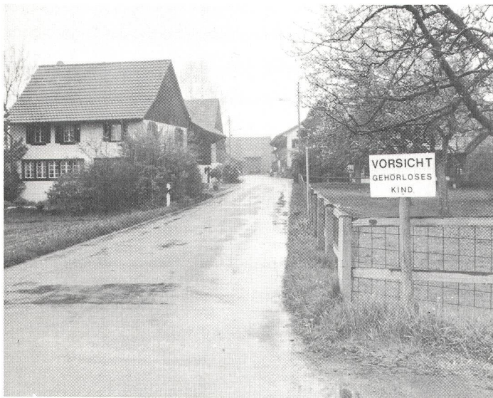
Das ungewöhnliche Schild im Strassenverkehr.