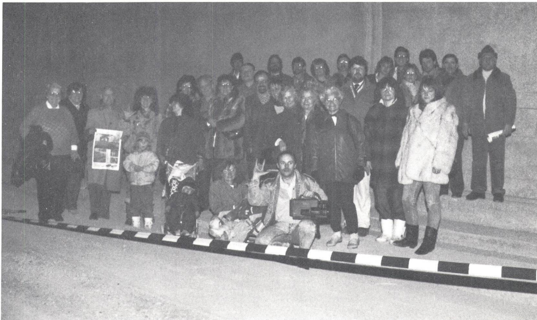
Gruppenbild im Tunnel.

Jedermann weiss: In Zürich sind Maulwürfe am Werk. Der Hauptbahnhof ist eine grosse Baustelle, der neue S-Bahn-Bahnhof wird gebaut, und auch im neuen S-Bahnnetz tut sich einiges.