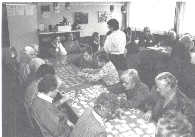
Hier wird eifrig gespielt und geplaudert.

Es wird von der Beratungsstelle für Gehörlose Zürich organisiert und findet einmal im Monat, an einem Mittwochmittag, von 14 bis 17 Uhr, statt.