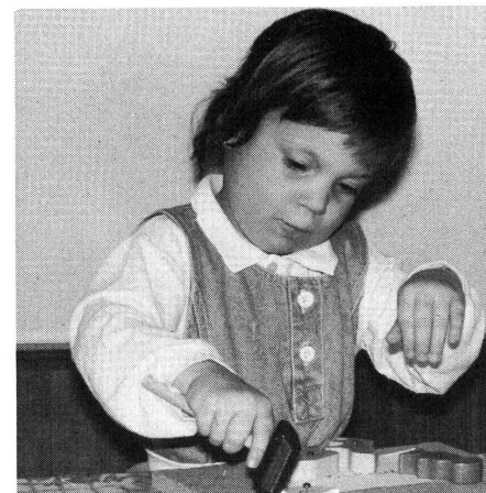
Mit viel Eifer beim Hammerspiel.

Ich schätze die Vielseitigkeit in meinem Beruf. Jede Woche, jeder Tag gestaltet sich wieder neu.