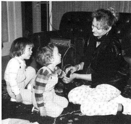
Die Kinder bei einer Tastübung: Was ist im Sack?

D. Lubé: Hier muss man unterscheiden, wer das Zielpublikum ist. Wenn ich mit gehörlosen Eltern arbeite, dann hat die Familie bereits einen ganz anderen Zugang zu diesem Kommunikationsmedium. Wenn ich schwerhörige Kinder betreue, stellt sich das Problem von lautsprachbegleitenden Gebärden kaum; dagegen ist hier die Wahl zwischen Schriftsprache und Dialekt das zentrale Anliegen der Eltern. Die Eltern, die sich dafür entschieden haben, mit Hilfe der lautsprachbegleitenden Gebärden die Sprach- und Sprechentwicklung ihres Kindes zu unter-