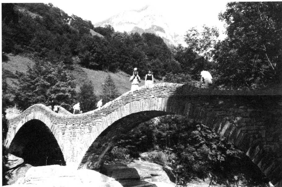
Mit «Kind und Kegel» unterwegs durch herrliche, unverbrauchte Landschaften, über Stock und Stein.

21 Kleinkinder, von wenigen Monaten bis zu 8 Jahren, den ganzen Tag getrennt von den Eltern zu hüten, war sicher keine leichte Aufgabe für die Betreuerinnen. Einigen war die lange Abwesenheit der Eltern einfach zuviel. Da mussten ab und zu Mütter oder Praktikantinnen etwas aushelfen. Dennoch verbrachten die Kleinen miteinander schöne Stunden: Musik hören von der Gitarre, Töpfern, Basteln, Spielen und Baden im Riesenplanschbecken. Es war schön zu sehen, wie sich manchmal 15 Kleinkinder in einem einzigen Becken vergnügten.