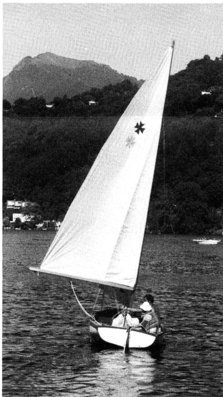
Gekonnt die Kraft des Windes nutzen: Die Segelschüler in Magliaso haben es im Griff!

Segeln ist nicht so einfach wie Töpfern. Ein guter und erfahrener Segellehrer nützt nicht viel, wenn der Wind nicht blasen will! Aber der Wind alleine genügt ja nicht, um schön auf den See hinaus zu