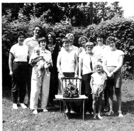
Die Töpfergruppe posiert vor der Kamera mit einem ihrer Kunstwerke. Sinnvolle Freizeitbeschäftigung wurde in Magliaso von allen begrüsst.