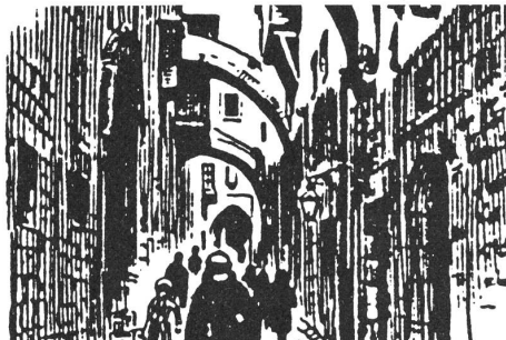
Die Via Dolorosa

Am Nachmittag sahen wir den Menora vor dem Gebäude der Knesset (Parlamentsgebäude), anschliessend besichtigten wir das israelische Museum. Später fuhren wir zum Berg Zion, wo wir die Kirche Doromitio Sanctae Mariae (Todes-schlaf Marias) anschauten. Nach dem Nachtessen im Hotel machte eine kleine Gruppe einen Abendspaziergang zum Ölberg.