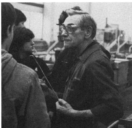
Der Galvaniseur. (Foto 3)

Wird bei der Kontrolle festgestellt, dass ein Teil geschwächt oder abgenutzt ist, wird es neu aufgearbeitet. Dazu kommt es zum Beispiel in die Galvanisierabteilung (Foto 3). Je nach Verwendungszweck müssen die Teile verchromt, verkupfert, versilbert oder gar vergoldet werden. So behandelte Teile müssen nachher aber wieder auf die genauen Richtmasse gearbeitet werden. Dies geschieht durch Schleifen oder Drehen. Dazu stehen bei der SWISSAIR modernste Maschinen zur Verfügung. An einer solchen Maschine hat uns Herr Isenschmid, ein Gehörloser, seine Arbeit erklärt (Foto 4).