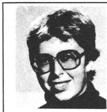
Ein Bericht unserer GZ-Redaktorin Trudi Bühlmann

In Nr. 5 der GZ erschien der Hinweis auf diese Tagung. Die Veranstalter hatten schon einen grossen Erfolg, bevor die Tagung begann: Weil sich so viele Interessenten meldeten, musste die Tagung in einen Hörsaal der Universität verlegt werden. Die Organisation war ausgezeichnet; von den Wegweisern über die Ringleitung bis hin zum Hellraumprojektor, an dem alles zu lesen war, hatte man an alles gedacht – und es funktionierte von Anfang an tiptopp!