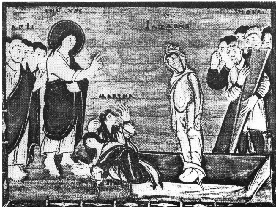
Der Mensch kann sich das Neue Leben nicht selber geben. Er muss – wie Lazarus – dazu erweckt werden.

Schild am Eingang eines Geschäftes in Marseille: «Heute ist ein zu schöner Tag, um Geschäfte zu machen. Folgen Sie meinem Beispiel: Gehen Sie ans Meer, geniessen Sie den Tag, und essen Sie am Abend etwas besonders Gutes. Morgen bin ich dann wieder für Sie da. Auf Wiedersehen!»