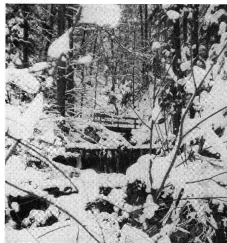
Wintereinbruch auf Wasserfallen (Basel-Land).

Aus «Adlerpost» (Cluborgan des Auto-Velo-Clubs «Adler», Dübendorf) WaG