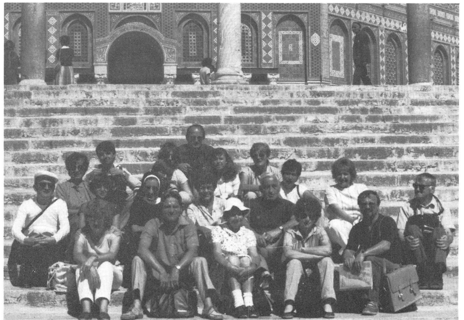
Die Reisegruppe vor der Omar-Moschee in Jerusalem