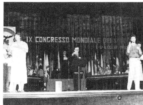
Dolmetscher übersetzen simultan

Vom 2. bis 5. Juli besuchten die Teilnehmer des Kongresses die Universität Palermo und verteilten sich dort auf die Hörsäle der 6 verschiedenen Kommissionen. 215 Referate aus vielen Ländern wurden Mitte Mai am Sitz des Weltverbandes