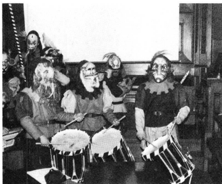
Die Fasnachtsclique «Optimische» im Einsatz.