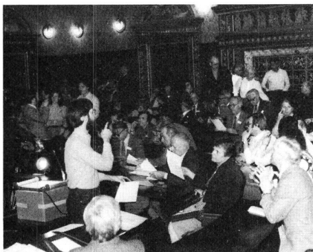
Eine kleine Pause tut gut – vielleicht auch für die Verdauung des SGB-Arbeitsprogrammes.