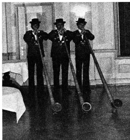
Mächtig dröhnten die Melodien im Saal ...

Die Verbandstagung nahm einen guten und schönen Verlauf. Die Gemeinschaft