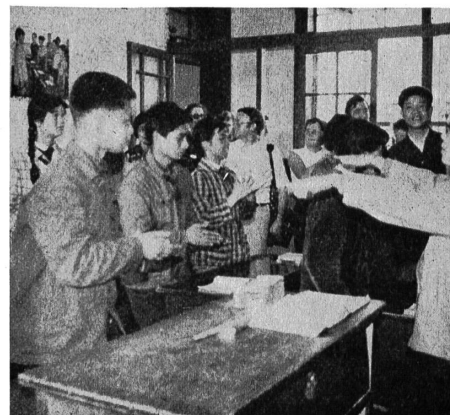
Fröhliche Kinder in der Gehörlosenschule in Schanghai.