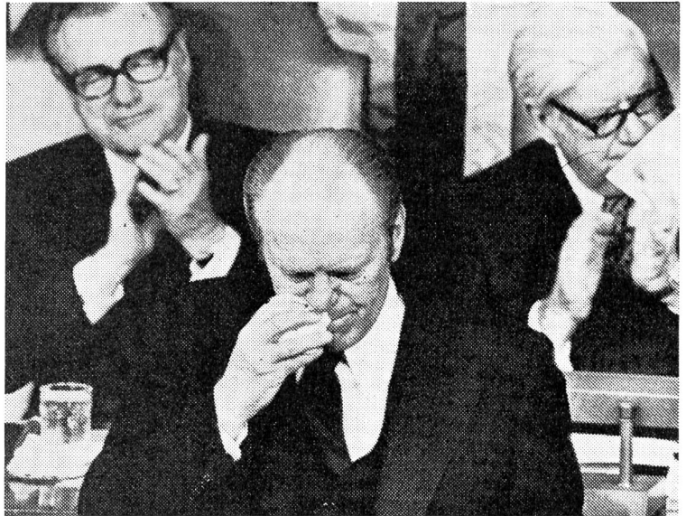
Eine Woche vor dem Ablauf seiner Amtszeit sprach Präsident Gerald Ford zum letztenmal vor dem Kongress der USA. Hinter ihm links der bisherige Vizepräsident Nelson Rockefeller, der sein Amt ebenfalls verloren hat. — Ford brach am Ende seiner Ansprache zusammen, der Abschied ging ihm sehr zu Herzen.

Seit dem Amtsantritt von Jimmy Carter ist Gerald Ford wieder ein Privatmann geworden. Er flog gleich von Washington nach Kalifornien. Schon am nächsten Tag ging er auf den Golfplatz von Pebble Beach und nahm an einem Golfturnier teil. Er war der