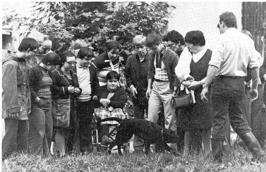
Zum Beispiel in der Freizeit, wie das Muster der Freizeitgruppe Winterthur/Andelfingen zeigt.