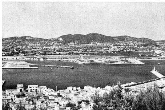
Teilansicht des Hafens von Ibiza

Am Montagabend schauten wir im Nachtlokal «Mar Blau» spanische Folklore an (Volkstänze usw.). Am Mittwoch fuhren wir kreuz und quer durch die Insel Ibiza. Ausserhalb der Stadt Ibiza besichtigten wir die Töpferei. Unterwegs nach San Antonio besuchten wir die Grotte Cova Santa. In San Antonio machten wir den ersten Halt und bummelten in der Stadt. Mittags um 12.30 Uhr ging's weiter zum Tierpark «Phantasieland». Dort werden verschiedene Tiere vorgeführt, und Seehunde, Dresseurperde und Papageien zeigen, was sie gelernt haben. Wir fuhren durch eine malerische Landschaft. Die Gegend ist