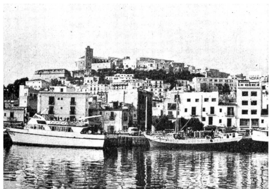
Wie eine Burg thront die Kathedrale von Ibiza auf dem Hügel im Hintergrund über der Stadt