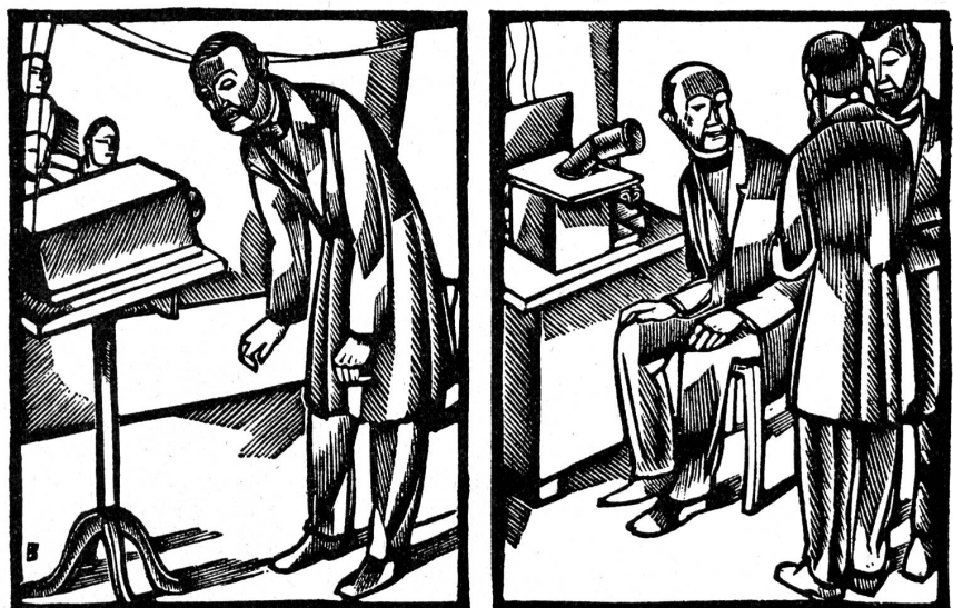
Unser Bild zeigt die beiden Stationen der ersten Versuchslinie, die Alexander Graham Bell im Jahre 1877 eingerichtet hatte. Was in Salem (links) gesprochen oder musiziert wird, hört man in Boston (rechts). Zu solchen Vorführungen erschien oft Tausende von Zuhörern.

Der junge Erfinder meldete sein Telefon zum Patent an. Am 7. März 1876 erhielt Bells Erfindung die Patentnummer