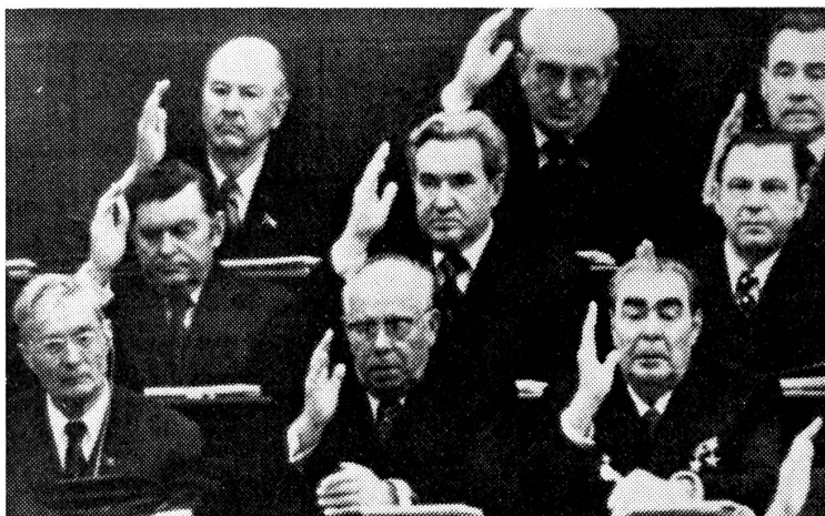
Oberster Sowjet: Alle gleicher Meinung.

Aber auch er ist nicht allmächtig. Er kann vom Politbüro abgesetzt werden, wie dies vor einigen Jahren seinem Vorgänger Chruschtschew passierte. Er befand sich auf einer Reise in eine weit von Moskau entfernte Sowjet-Republik. Als er wieder heimkam, sass sein Freund Breschnjew auf dem Stuhl des 1. Sekretärs. Dies könnte ihm eines Tages auch passieren. Kürzlich hiess es nämlich, er sei krank. Das könnte so etwas wie eine Voranmeldung seiner baldigen Absetzung sein. Denn Breschnjew hat in der letzten Zeit einige Misserfolge gehabt. Vielleicht macht er darum auf dem Bilde so ein ernstes, verschlossenes Gesicht. Ro.