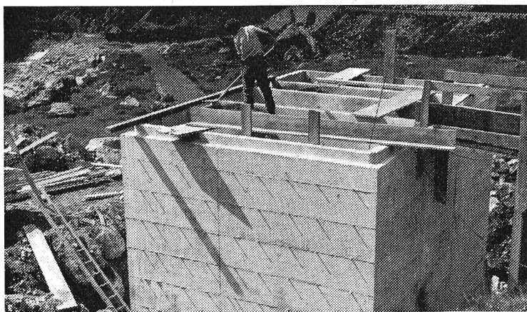
Ganz oben in den Bergen beginnt bereits die Verschmutzung unserer Gewässer.

Verwundert haben wohl in den letzten zwei Monaten viele der unzähligen Teilnehmer an Passfahrten über den Susten beim Anblick von Baustellen gefragt: Was wird denn hier wieder gebaut? — Es handelt sich um die Bauten einer Kläranlage. Schon seit langem musste man feststellen, dass die munter talwärts fließenden Bergbäche durch die Abwässer aus Gastbetrieben, Touristenlagern und Truppenunterkünften arg verschmutzt werden. Die im Sommer