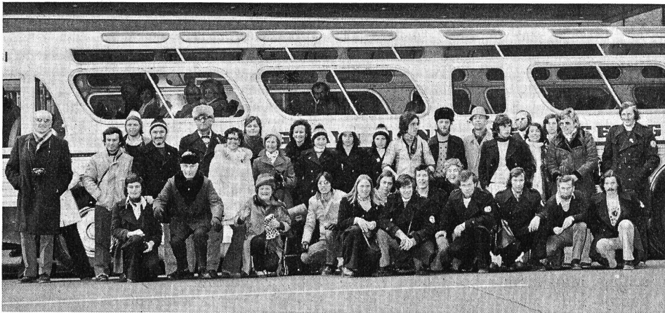
Familienbild der Sportler und Schlachtenbummler vor dem riesigen Autocar, der sie nach dem Abschluss der Winterspiele nach New York brachte.

Beinahe alle Jahre wieder gibt es eine Stolpererei bei der Hürde Abrechnungen der Unterabteilungen. Bei der Abrechnung der Abteilung Fussball wurde eine neue, klarere Darstellung gewünscht.