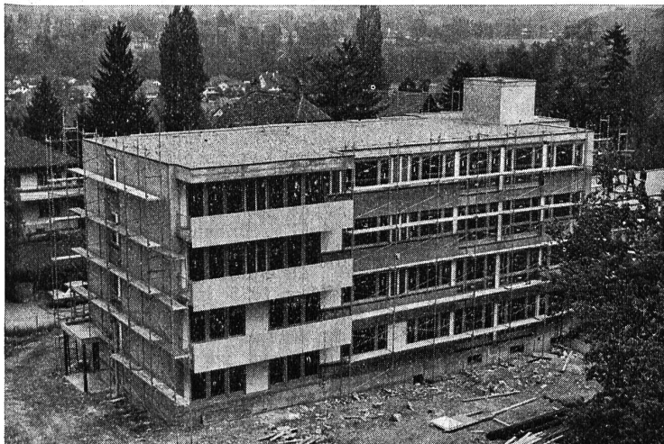
Neubau in Wabern